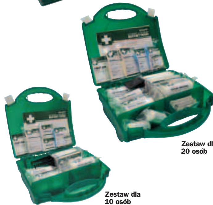
Zestaw dla 20 osób