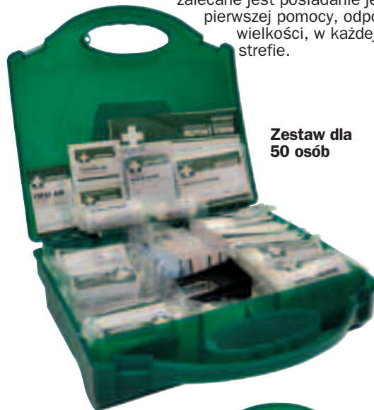
Zestaw dla 50 osób